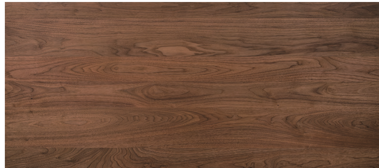
大きな節・白太のない木目