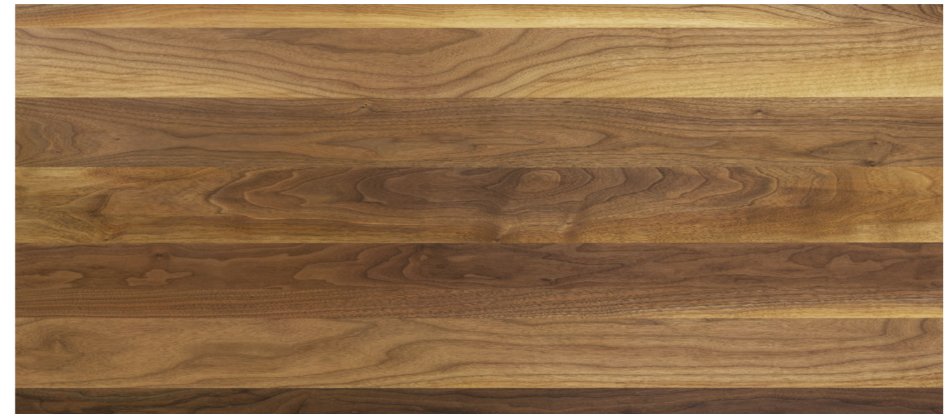
接ぎ枚数・板幅の差