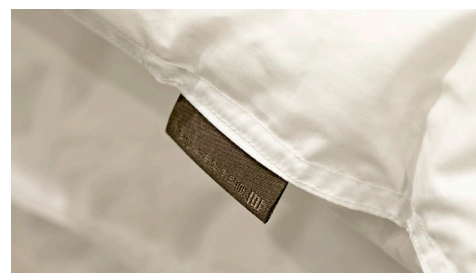
マスターウォール タグ