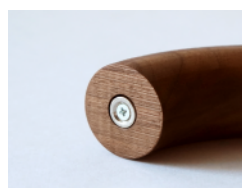
金具(ラウンド:磁石)

無垢材 / オイル仕上げ (ネオジウム磁石付) ベルト/本革 ※ナチュラルマークを活かした商品です。 金具/真鍮 (一部ゴールドメッキ)