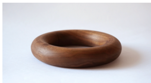
ウッドリング(ラウンド)