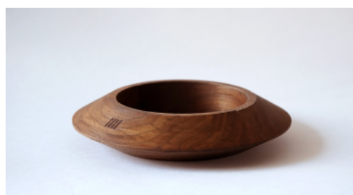
ウッドリング(カット)