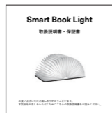
取扱説明書・ 保証書(本紙)