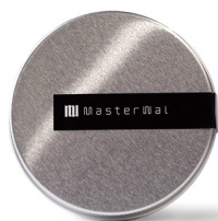
缶ケース(ロゴラベル付き)

フルーティな柑橘と花々の明るくクリアで広がりのある香りが、美しく輝く 銀座の街並みを彷彿とさせる、ラグジュアリーな雰囲気演出するブレンド。 | ベルガモット、ローズゼラニウム、スイートオレンジ、イランイラン