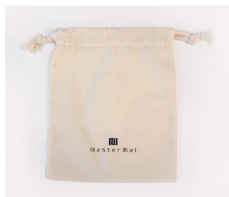
巾着袋(ロゴ プリント有り)