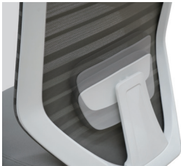
可動式ランバーサポート