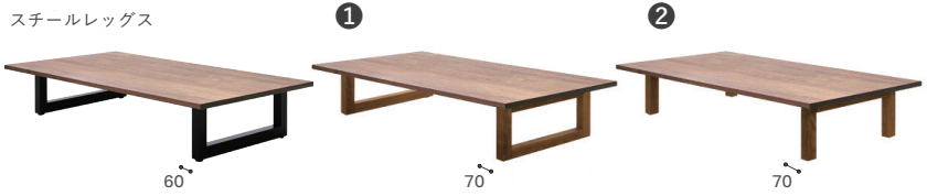
スチールレッグス

ウッド2・4レッグス：無垢材（天板同材） / オイル仕上げ アジャスター付（2レッグスのみ）