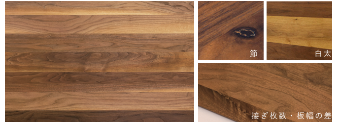
接ぎ枚数・板幅の差