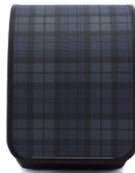
RANDSEL-TTG / タータングリーン