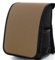
RANDSEL-COY / コヨーテ