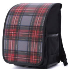
RANDSEL-TTR / タータンレッド