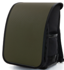
RANDSEL-OLV / オリーブ