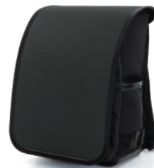
RANDSEL-NVY / ダークネイビー