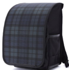
RANDSEL-TTG / タータングリーン