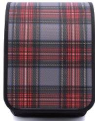
RANDSEL-TTR / タータンレッド