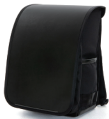
RANDSEL-LBK / ブラック