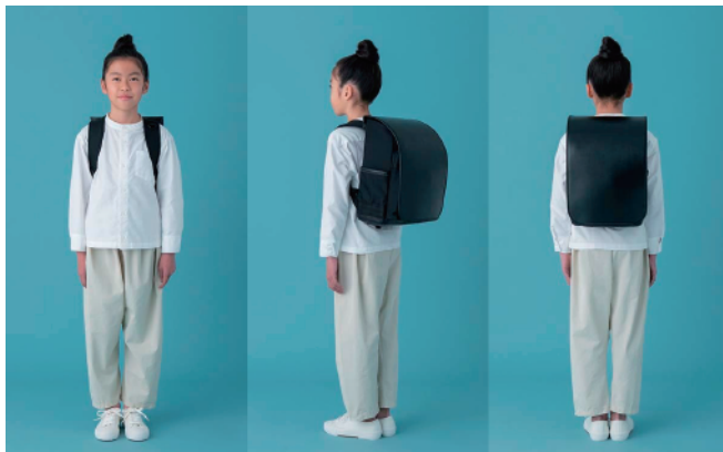
140cm / 小学5年生平均身長