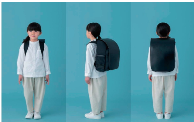
117cm / 小学1年生平均身長