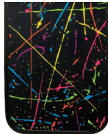
RANSSEL-HTP-SC / スブラッシュカラー