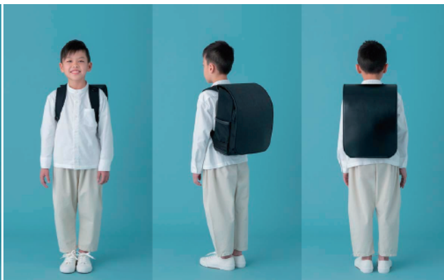
129cm / 小学3年生平均身長